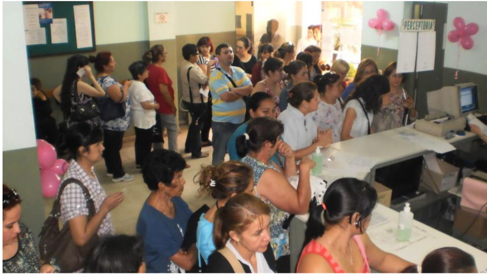
Pacientes tomando Turno