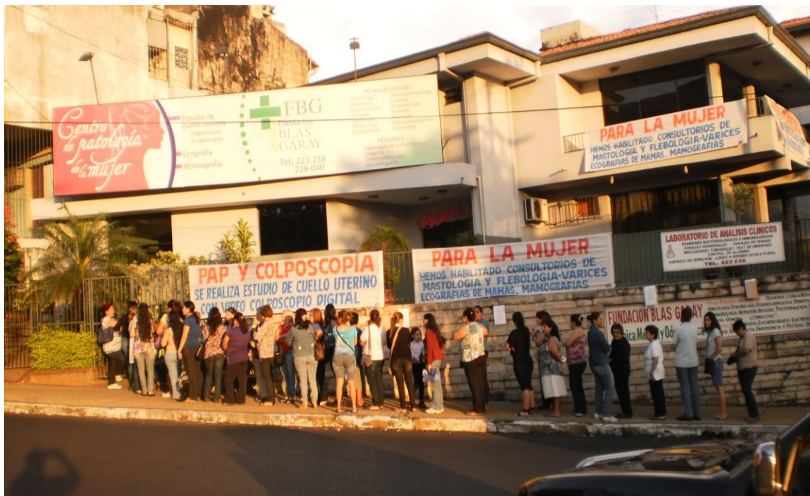
Pacientes a la espera de la Apertura del día - Época de vacunación