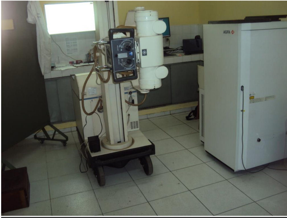
Sala de Rayos X