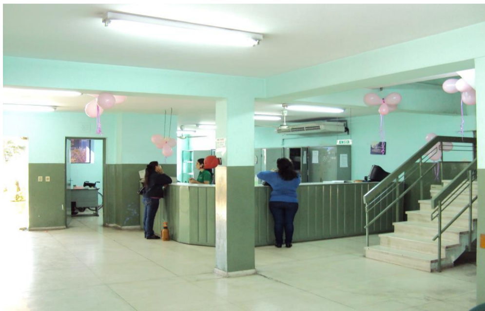
Área de Recepción - Planta Baja.