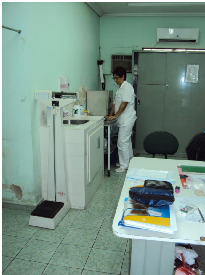
Sala de enfermería