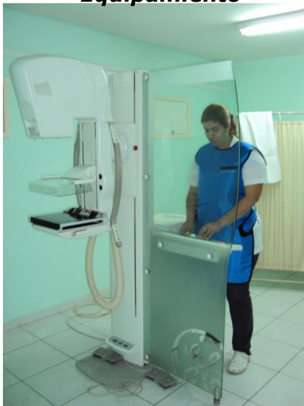
Mamografo, marca General Electric Senographe 800 T