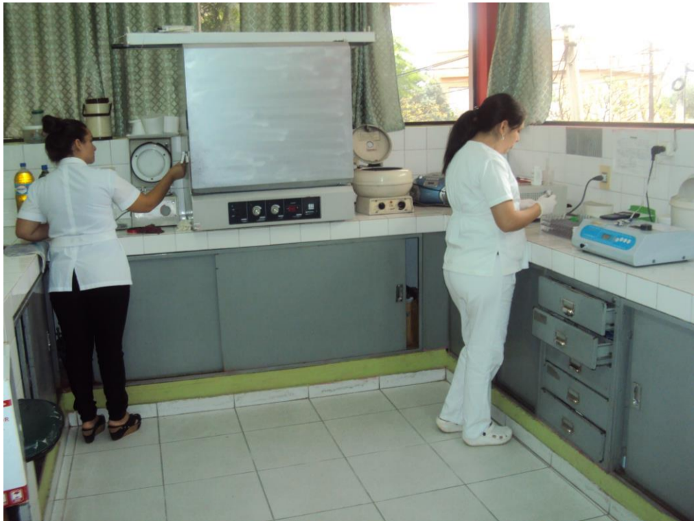
Laboratorio de Análisis Clínicos