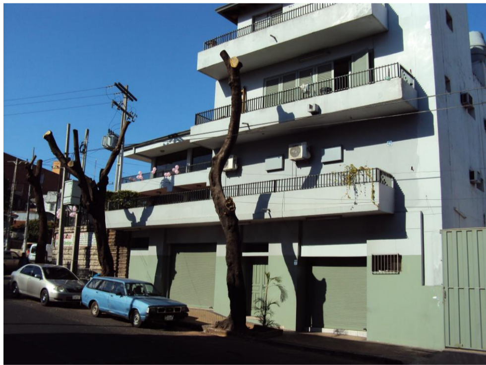
Fachada del Edificio de la Clínica Médica, sobre la calle Mongelos